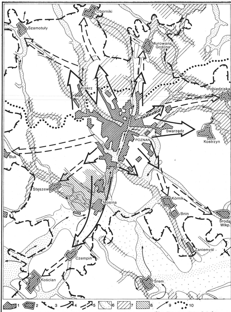
Abb. 1. Die Entwicklungstendenzen der Ballung Poznań und die „physiographischen“ Bedingungen ihrer Funktionstüchtigkeit (nach Bartkowski, 1972 a).

1 Urbanisierte Flächen, 2 Satellitenstädte mit alten Stadtkernen in ungünstiger Tallage, 3 1-h-Isochrome (vom Hauptbahnhof Poznań), 4 Entwicklungsrichtung der kompakten Bebauung (urbanisierte Gebiete), 5 Richtung der beginnenden Urbanisierung (sich aktuell urbanisierende Gebiete), 6 Hohlformen größeren Ausmaßes (Rinntäler, Flußtäler, Urstromtal und höhere Terrassen im Urstromtal) = Gebiete ungünstigen Topoklimas, aber reich an Grundwässern, die entweder rein (Punkte weitständig) oder verunreinigt (Punkte dicht) sind, 7 Landschaftsschutzgebiete, 8 Gebiet des „Großpolnischen Nationalparks“, 9 Fließrichtungen der verunreinigten Gewässer, 10 lokale Wasserscheide