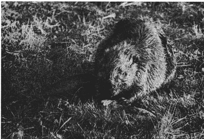
Abb. 2. Stark abgekommener, seniler Elbebiber, vor allem an den sich im Kellenbereich deutlich abzeichnenden Schwanzwirbeln zu erkennen

Der Schwanz dient ferner als Vorratsdepot für Reservefett. Aleksiuik (1970) stellte fest, daß die Fettprozentage im Schwanzgewebe in regulärer Weise markant fluktuieren. Der Fettanteil ist im Frühjahr niedrig, steigt während der Sommer- und Herbstmonate stark an und erreicht das Maximum im zeitigen Winter. Bis zum Frühjahr sinkt der Fettanteil dann wieder entsprechend ab. Im gleichen Zyklus steigt und fällt das