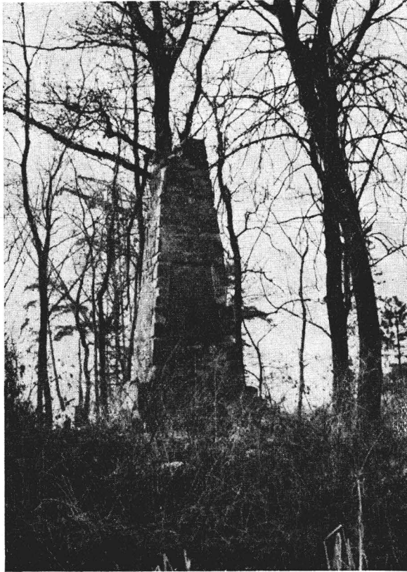
Abb. 6. Der „Graue Stein“ im Dieskauer Park