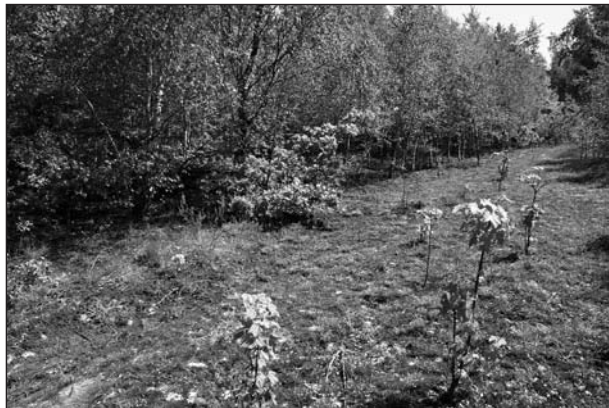
Abb. 5 Auf natürliche Sukzession zurückgehender Birken-Vorwald im Oberhangbereich (13.6.2006). Die kümmerlichen Ahorn-Bäumchen im Vordergrund gehen noch auf die Aufforstung im Jahr 1993 zurück. In unbeschatteten Bereichen wird die Krautschicht großflächig von Minuartia verna dominiert, die im Halbschatten der Birken von Armeria maritima ersetzt wird.