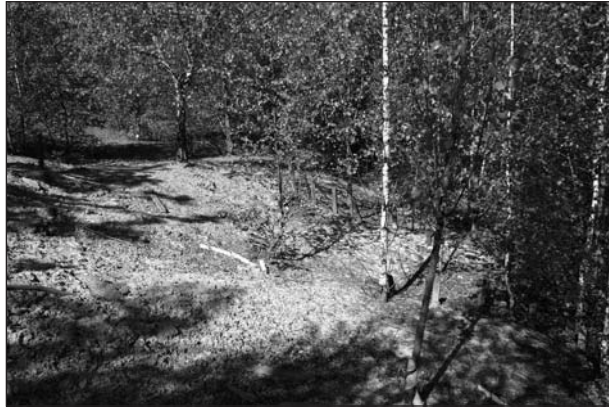
Abb. 4 Solifluktionserscheinungen im Übergangsbereich von Mittel- und Oberhang des westlichen Weinbergs (13.6.2006)