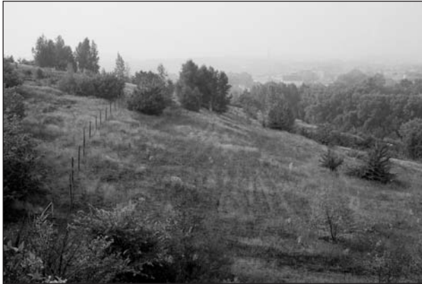
Abb. 2 Blick von der Halde des LL 31 Z nach Süden auf den mittleren Westhang des Weinbergs im September 1999. Der Vegetationsaspekt ist durch Schwermetallrasen ( Armerietum halleri ) geprägt. Unterhalb des Zaunes befindet sich die Aufforstungsfläche.

Fig. 2 View from the heap LL 31 Z to the south over the middle Weinberg slope (September 1999). Slope aspect is characterized by metalicolous vegetation ( Armerietum halleri ). The afforestation site is located beneath the fence.