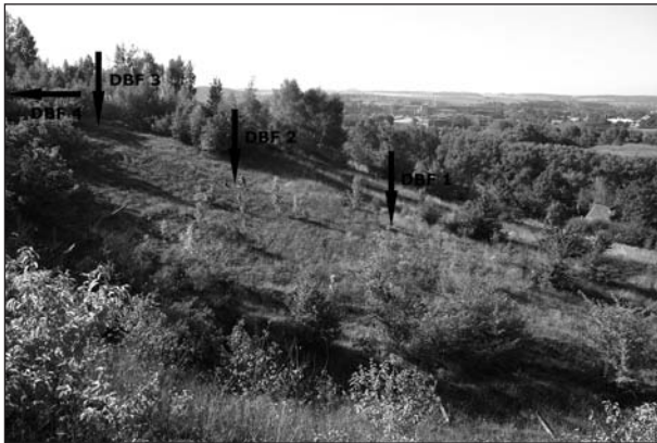
Abb. 3 Blick vom gleichen Standort im September 2006. Deutlich erkennbar ist die starke Birkensukzession im Übergangsbereich von Mittel- und Oberhang (links). Die starkwüchsigen Einzelgehölze am Mittelhang sind vor allem Birken und Holzbirnen. Die Krautschicht besteht immer noch ausschließlich aus Schwermetallrasen. Die Pfeile kennzeichnen die Lage der Dauerbeobachtungsflächen. Im Hintergrund befindet sich die Kupfer-Silber-Hütte.

Fig. 2 View from the heap LL 31 Z to the south over the middle Weinberg slope (September 1999). Slope aspect is characterized by metalicolous vegetation ( Armerietum halleri ). The afforestation site is located beneath the fence.