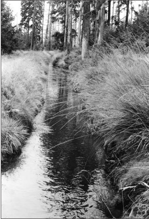
Abb. 5: Clausthaler Flutgraben