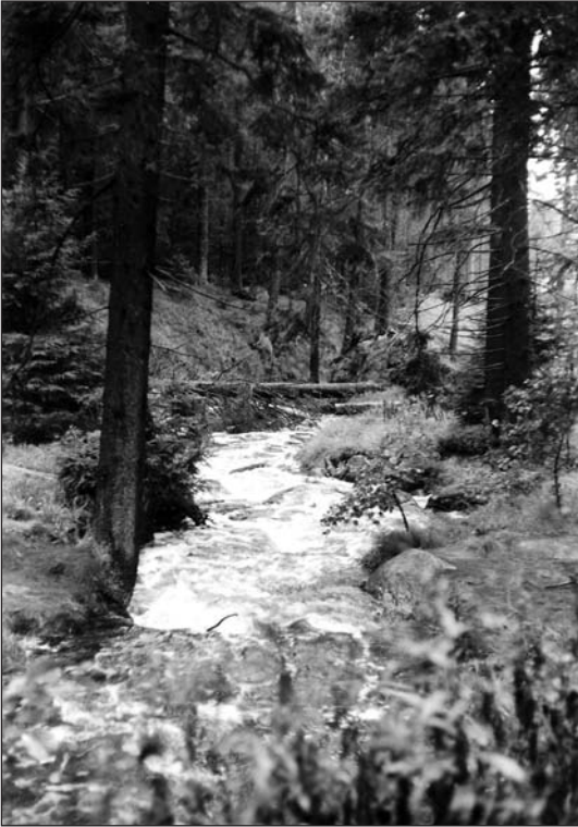
Abb. 3: Nebenfluß der Oder bei Hochwasser