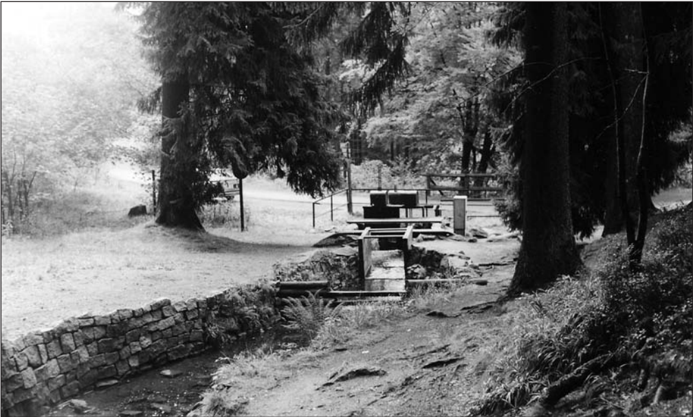
Abb. 4: Rehberger Graben