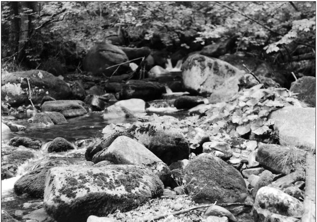
Abb. 2: Oderflußbett bei Niedrigwasser

Zusätzlich zu den eigentlichen Wassermoose-Gesellschaften wurden auch die Moosgesellschaften untersucht, die sich in unmittelbarer Ufernähe auf Erdanrissen und Uferböschungen entwickeln. Sie werden bei Hochwasser zwar deutlich von den Fließgewässern beeinflusst, sind aber nicht nur von Wassermooseen aufgebaut und können damit auch in größerer Entfernung von den Flüssen vorkommen.