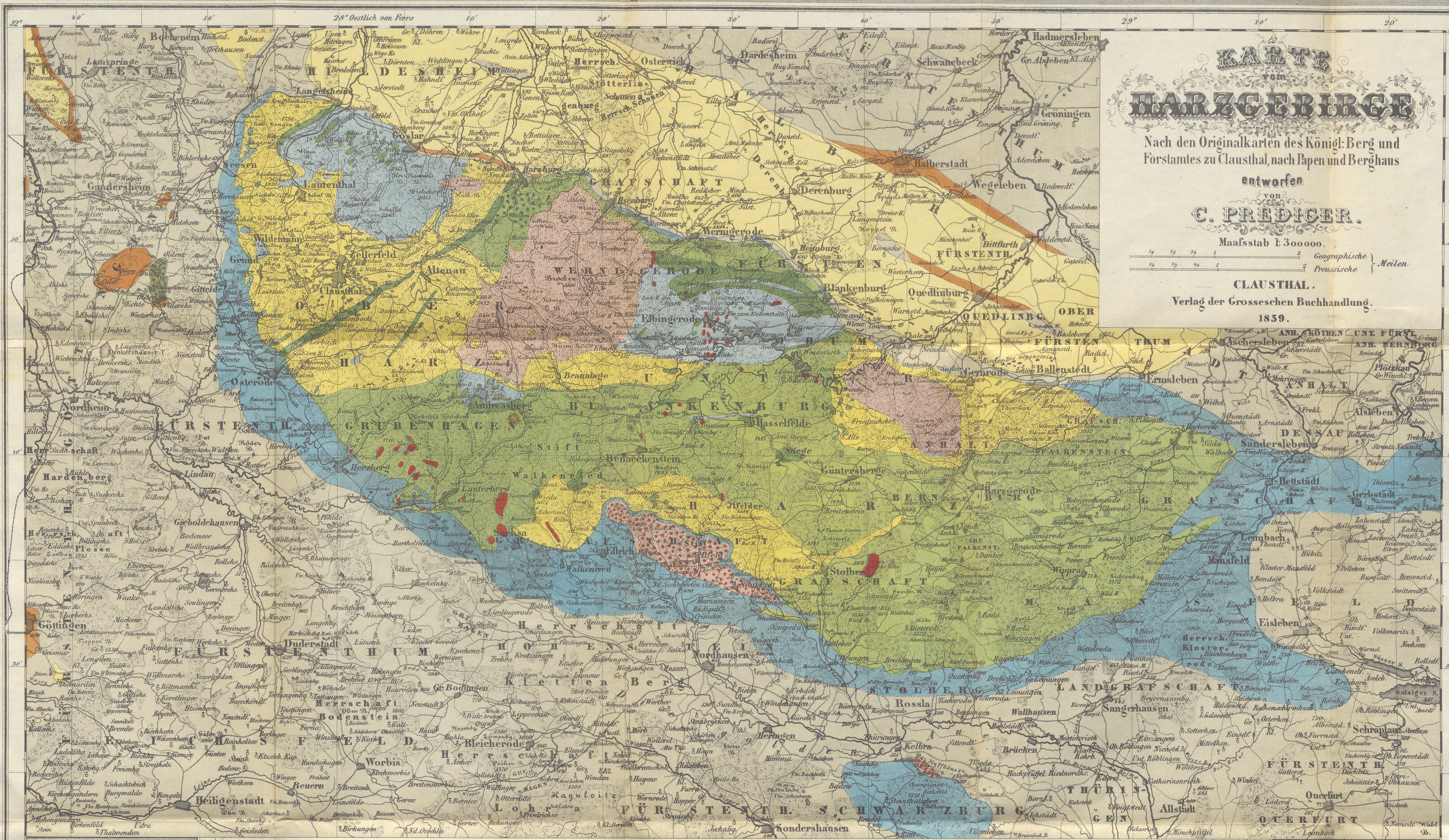
PROFILANSICHT DES HARZGEBIRGES.

CLAUSTHAL. Verlag der Grossschen Buchhandlung. 1859.