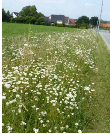
Landschaftssaum Wallenhorst (Stadtweg) nach 22 Monaten, Ansaat mit 27 Arten