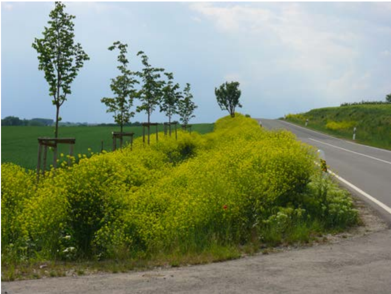
Neophytensaum mit Orientalischer Zackenschote [2]

Deshalb ist es notwendig, bei einer Aufwertung und Neuanlage von Säumen und Feldrainen, entsprechende Zielarten aktiv über Einsaaten einzubringen. Leider enthalten viele handelsübliche Samenmischungen zur Anlage von Saumstrukturen und mehrjährigen Blühstreifen bisher überwiegend kurzlebige Kulturarten und Zuchtsorten (z. B. Buchweizen, Bartnelke), z. T. sogar problematische Neophyten (Lupine, Orientalische Zackenschote), die spezialisierten Tierarten (z. B. Wildbienen, Schwebfliegen) wenig Nutzen bringen. Diese Mischungen zeigen zwar im ersten Jahr nach der Ansaat einen Blühaspekt; im zweiten oder dritten Jahr fallen die meisten dieser Arten jedoch wieder aus, da sie in Konkurrenz zu den sich entwickelnden Ruderalarten und Gräsern nicht bestehen können. Bei Neophyten besteht dagegen die Gefahr, dass sie dauerhaft Dominanzbestände bilden und in die Umgebung einwandern. Speziell an Naturräume angepasste Samenmischungen für Säume und Feldraine mit gebietsheimischen ausdauernden Wildpflanzenarten werden bislang leider nur selten eingesetzt.