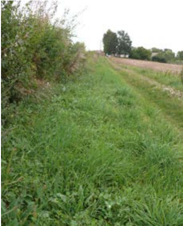
Landschaftssaum Zellewitz 2 nach 11 Monaten, Ansaat mit 49 Arten