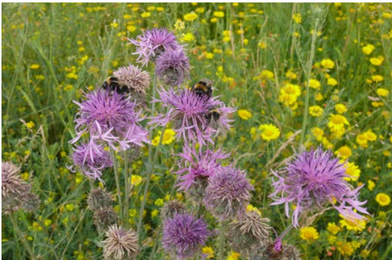
Hummeln auf Skabiosen-Flockenblumenblüten; im Hintergrund Färber-Hundskamille.