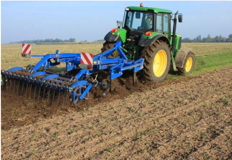
Bodenvorbereitung durch Grubbern [16]

Eine wichtige Voraussetzung für eine erfolgreiche Aufwertung bzw. Neuanlage blütenreicher mehrjähriger Säume und Feldraine ist eine intensive Bodenstörung (Jeschke et al. 2012, Kiehl et al. 2014). Bei Aufwertungen von Grassäumen ist der Etablierungserfolg der angesäten Arten umso höher, je gründlicher die Grasnarbe zerstört wird. Die Bodenbearbeitung kann durch Fräsen, Grubbern oder Pflügen erfolgen. Anschließend sollte mit einer Egge oder Kreiselegge ein möglichst feines Saatbett hergestellt werden (für Lichtkeimer besonders wichtig).