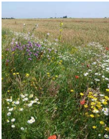
Blockversuch Bernburg nach 32 Monaten, Ansaat mit 49 Arten, Vorbehandlung 1x Fräsen, Folgepflege September-Mahd