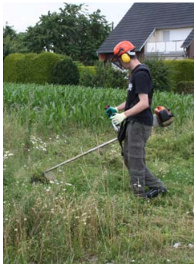
Selektives Ausmähen von Disteln [22]