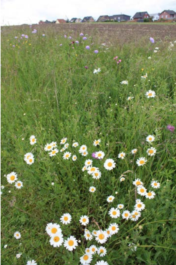
Neu angelegter Feldrain auf einer Gemeindefläche im Landkreis Osnabrück, 33 Monate nach der Ansaat [27]

Da von blütenreichen mehrjährigen Wildpflanzensäumen oftmals verschiedene Nutzer- bzw. Gesellschaftsgruppen profitieren, hat es sich in der Praxis als erfolgreich erwiesen, wenn mehrere Nutzergruppen an der Planung, Umsetzung und Pflege beteiligt sind. So können regionale Kooperationen von Landwirten, Imkern, Jägern, Vereinen, Verbänden, Stiftungen und/oder lokalen Initiativen von Bürgern in gemeinsamer Regie aktiv werden. Eine Umfrage der Hochschule Osnabrück unter verschiedenen Akteuren aus der Praxis hat gezeigt, dass die eine solche Zusammenarbeit vielfach erwünscht ist (Budelmann et al. 2017).