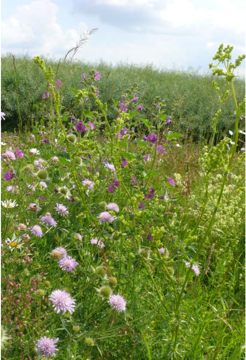
Artenreicher Feldrain im 4. Jahr nach der Ansaat; Aspekt mit Wilder Malve und Wiesen-Witwenblume [32]