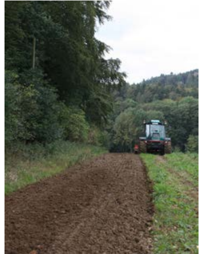
Neuanlage am westexponierten Waldrand [8]