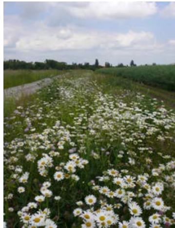
Blockversuch Bernburg nach 32 Monaten, Ansaat mit 49 Arten, Vorbehandlung 1x Fräsen, Folgepflege Juni-Mahd