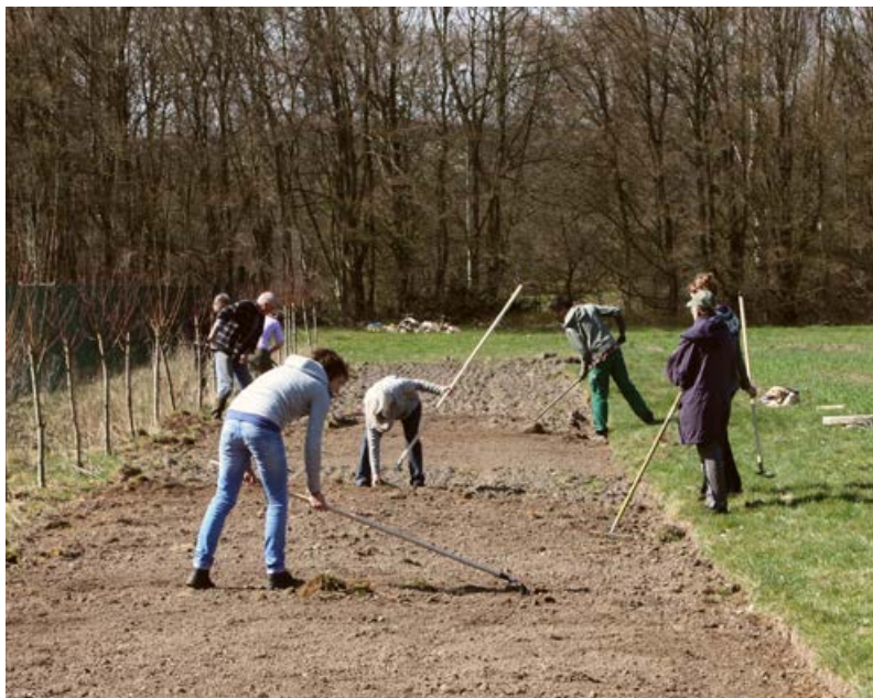
Gemeinschaftsaktion als Beispiel für eine Umsetzung im besiedelten Raum [19]

Heu (ca. 300-500 g/m 2 Trockengewicht) empfehlenswert, um günstige Bedingungen für Keimung und Etablierung der angesäten Arten zu schaffen. Die Schicht sollte im frischen Zustand maximal 3-5 cm dick sein. Frisches Material haftet durch den Trocknungsprozess am Boden und kann nicht verweht werden. Heu muss eine Nacht auf der Fläche liegen bleiben, damit es Feuchtigkeit aufnehmen kann. Um das zu gewährleisten, muss es unter windstillen Bedingungen ausgebracht werden. Langhalmiges Material ist ein besserer Erosionsschutz als gehäckseltes Material. Bei langanhaltender trockener Witterung im ersten Jahr nach der Ansaat ist unter Umständen das Liegenlassen (Mulchen) des Pflegeschnittes eine Möglichkeit, um die Austrocknung der Flächen zu vermindern und die Keimungs- und Etablierungsbedingungen zu verbessern. Dies funktioniert nur, wenn aufgrund von Trockenheit oder Nährstoffarmut nur wenig Biomasse gebildet wurde und damit durch das Mulchen keine dichte Streuschicht entsteht, die zur Verschlechterung der Keimungsbedingungen führen würde.