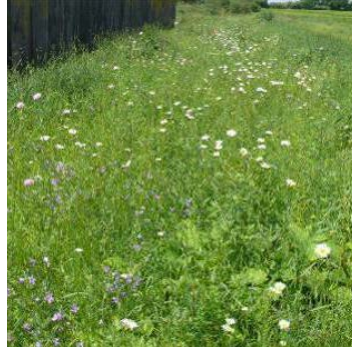
Landschaftssaum Lindau 2 nach 21 Monaten, Ansaat mit 46 Arten und Ammensaat