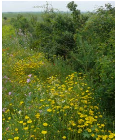
Landschaftssaum Zellewitz 2 nach 20 Monaten, Ansaat mit 49 Arten