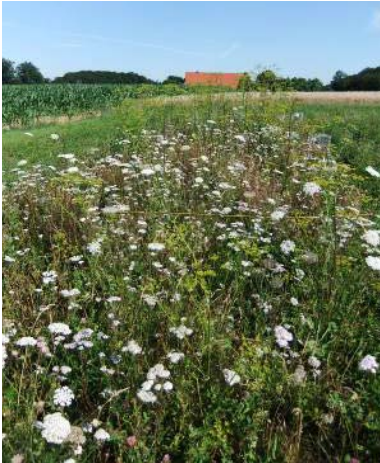
Blockversuch Wallenhorst nach 22 Monaten, Ansaat mit 37 Arten, Vorbehandlung 1x Fräsen, Folgepflege September