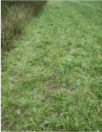
Landschaftssaum Wallenhorst (B68-3) nach 10 Monaten, Ansaat mit 27 Arten