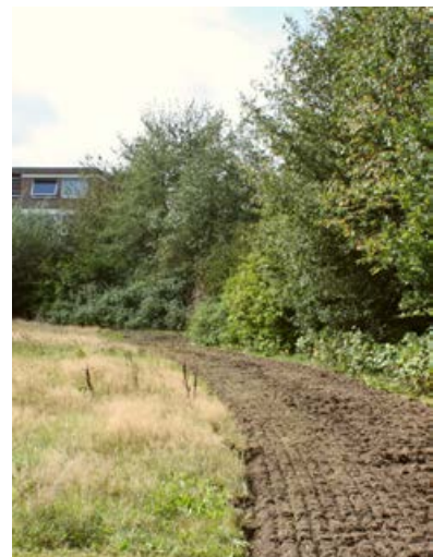
Neuanlage im besiedelten Bereich [10]