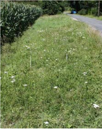
Landschaftssaum Wallenhorst (In der Barlage) nach 11 Monaten, Ansaat mit 27 Arten