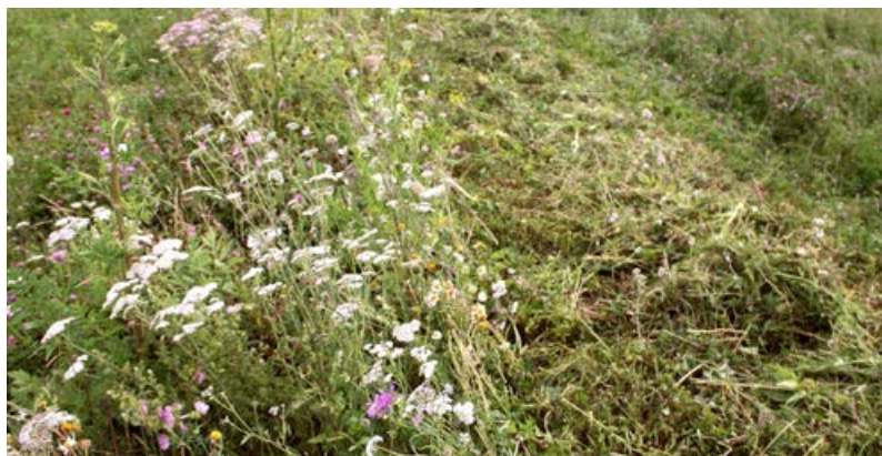
Halbseitig gemähter Saum [24]

tet, der insbesondere für Wildbienen eine große Bedeutung besitzt. Die gemähten Abschnitte sollten dabei jährlich getauscht werden, da eine dauerhaft späte Mahd Gräser fördert (Kiehl & Kirmer 2019). Im Herbst und Winter können Vögel die Samen als Winterfutter und Insekten die hohlen Stängel als Überwinterungshabitate nutzen. Auf sehr nährstoffarmen Flächen kann auch ein jährlich wechselnder Teil ungemäht stehen bleiben (hälftig, jährlich alternierend).