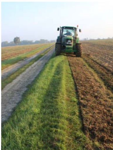
Neuanlage am Ackerrand [9]