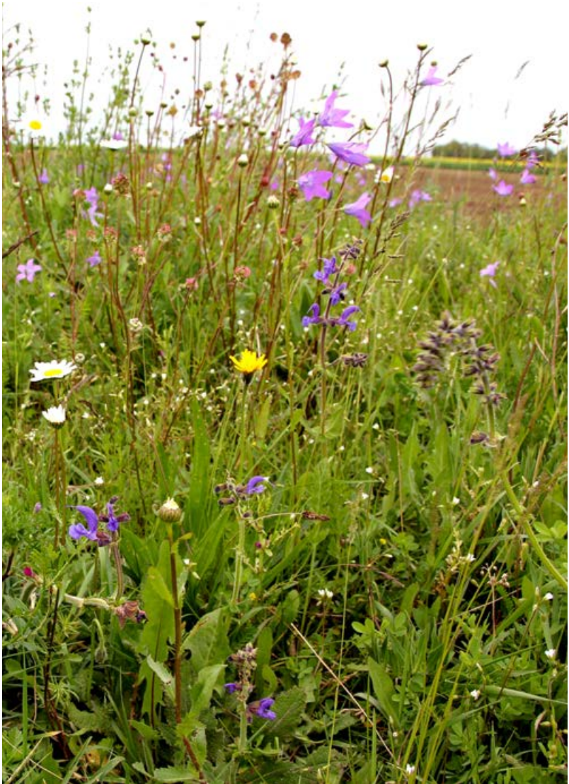
Erfolgreiche Renaturierung eines struktur- und artenreichen Felddrains, Frühsommeraspekt im 4. Jahr nach der Ansaat [31]