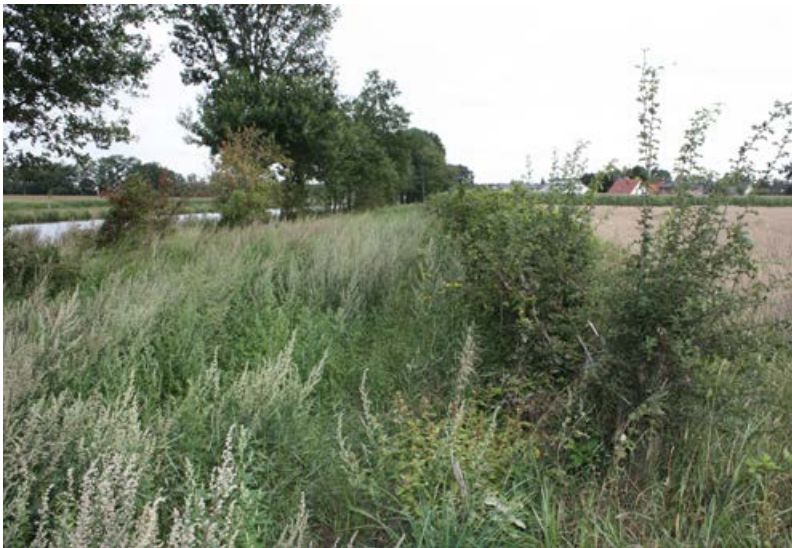
Durch fehlende Pflege ruderalisierter Feldrain [5]

Kleinräumig noch vorhandene arten- und blütenreiche Säume und Feldraine als typische Elemente extensiv genutzter Kulturlandschaften sind unbedingt zu erhalten. Dies kann nur durch eine optimale Nutzung oder Pflege (Beweidung oder Mahd) gewährleistet werden. Auf nährstoffärmeren Standorten ist es oft ausreichend, die Flächen alle 2-3 Jahre im Spätsommer zu mähen oder zu beweiden. Um Winterquartiere für Insekten zu erhalten, sollte alternierend die Hälfte der Fläche stehenbleiben. Auf nährstoffreicheren Standorten sollten Säume und Feldraine einmal jährlich im Frühsommer gemäht werden, um konkurrenzkräftige Arten (insbesondere Gräser) zurückzudrängen und dann im Sommer und Spätsommer ein vielfältiges Nahrungsangebot für Insekten zu bieten. Der Aufwuchs kann als wertvolles Kräuterheu verwendet werden. Besonders produktive Standorte können im ausgehenden Winter zusätzlich (nicht stattdessen!) einmal gemulcht werden. Mulchen in der Vegetationsperiode ist unter nährstoffreicheren Bedingungen unbedingt zu vermeiden, da es langfristig zum Artenverlust führt.