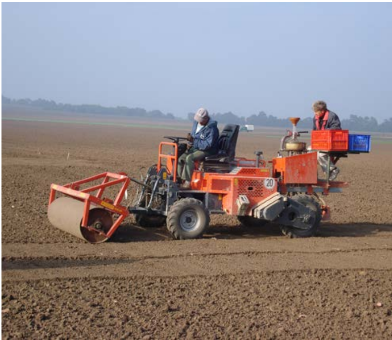
Ansaat mit kombinierter Drillmaschine [17]

Die Ansaat kann sowohl von Hand (kleinere Flächen bis 5000 m 2 ) als auch maschinell mit verschiedenen Sä- und Streugeräten erfolgen (Beispiele siehe Krautzer et al. 2012). Da die meisten Wildpflanzen Lichtkeimer sind, ist es wichtig, das Saatgut nicht in den Boden einzuarbeiten, sondern nur oberflächlich abzulegen. Bei der Verwendung von Drillmaschinen müssen deshalb Striegel und Säscharen hochgeklappt werden. Nach der Ansaat muss die Fläche mit einer Strukturwalze (z. B. Cambridge- oder Güttlerwalze) gewalzt werden, um den Bodenschluss der Samen herzustellen.