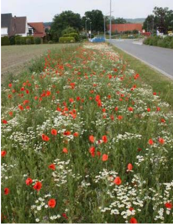
Landschaftssaum Wallenhorst (Stadtweg) nach 9 Monaten, Ansaat mit 27 Arten