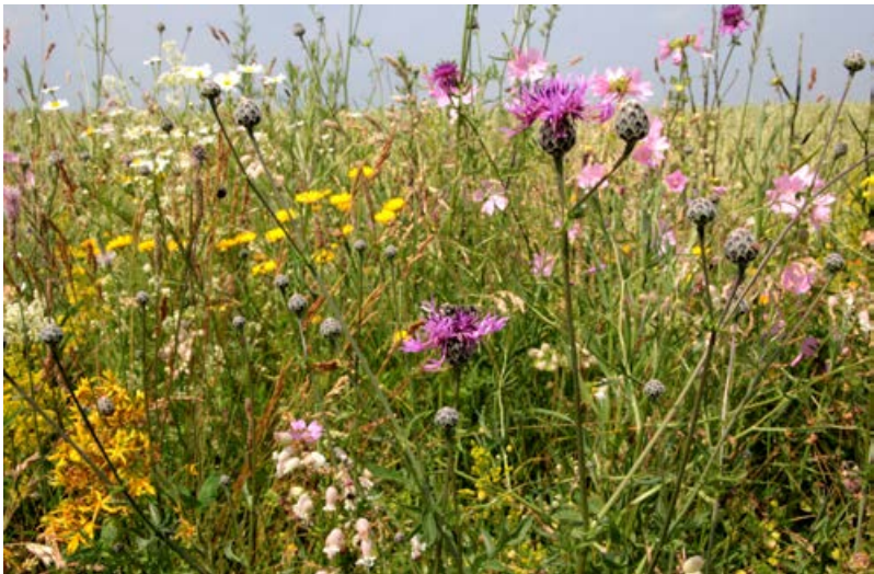
Artenreicher Feldrain im 3. Jahr [23]