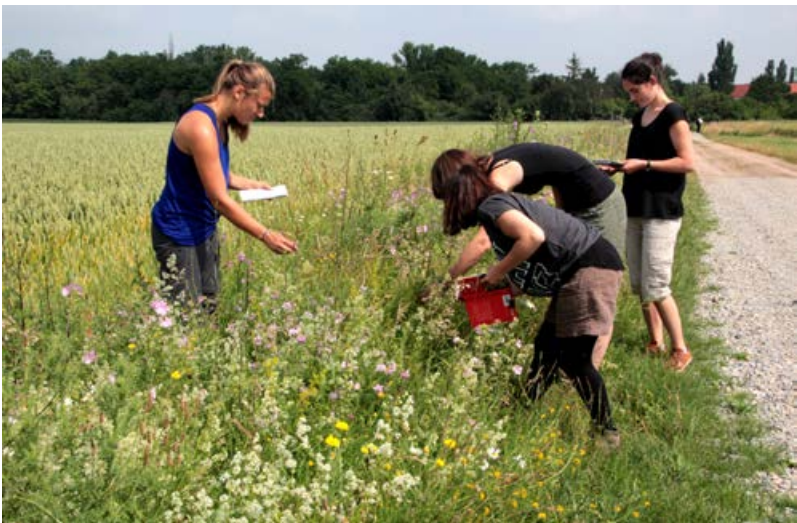
Monitoring im Rahmen einer Lehrveranstaltung [25]

Nur durch Erfolgskontrollen können Fehlentwicklungen entdeckt und rechtzeitig Gegenmaßnahmen (z. B. selektive Mahd, Änderung des Nutzungs- oder Pflegezeitpunktes oder der Intensität von Managementmaßnahmen) eingeleitet werden.