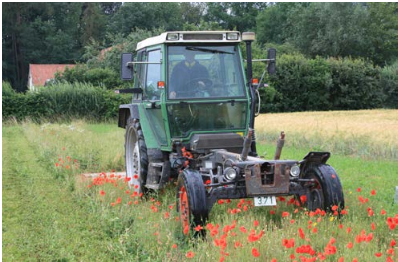
Schröpfschnitt im Frühsommer [20]

In der Regel kommt es im ersten Jahr nach der Ansaat zu einem Massenaufreten unerwünschter Pflanzenarten aus der Samenbank oder der näheren Umgebung (z. B. Melde, Gänsefuß, Acker-Kratzdistel, Geruchlose Kamille). Um diese Arten zurückzudrängen, muss vor oder zu Beginn ihrer Blüte ein Schröpfschnitt erfolgen (Tischew et al. 2012, Rieger 2013). Die Schnitthöhe sollte mindestens 10-15 cm betragen, um die Keimlinge und Jungpflanzen der angesäten Arten nicht zu beschädigen. Je nach Standort können in der Vegetationszeit 2-3 Schröpfschnitte erforderlich sein (meist Mai/Juni und Juli/August).