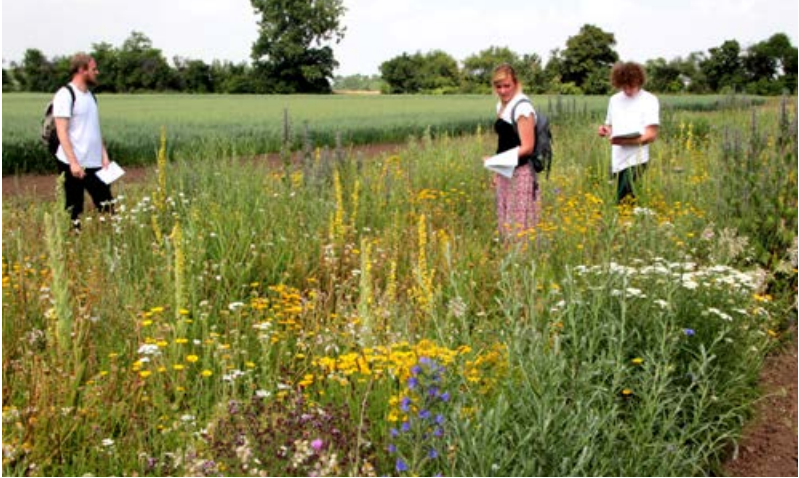
Mit Wildpflanzenansaatgut etablierter, mehrjähriger Blühstreifen im 3. Jahr [26]

Bei gelungenen Anlagen wäre es sinnvoll, in der folgenden Förderperiode den Erhalt und die Pflege als Agrarumweltmaßnahme zu honorieren, was in einigen Bundesländern bereits diskutiert wird. Sie würden dann zunehmend ökologische Funktionen von ausdauernden Feldrainen übernehmen.