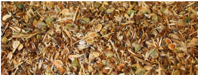
Mischung aus regional gesammeltem und vermehrten Saatgut [12]

Bei Wildpflanzenmischungen ist eine Ansaatstärke von 1-3 g/m 2 (entspricht ca. 1000-3000 Samen/m 2 ) ausreichend, im Gegensatz zu 10-20 g/m 2 bei handelsüblichen nicht-regionalen Kultur- und Zuchtsorten. Der höhere Preis des regional vermehrten Wildpflanzensaatguts kann also z. T. durch die wesentlich geringeren benötigten Mengen ausgeglichen werden.