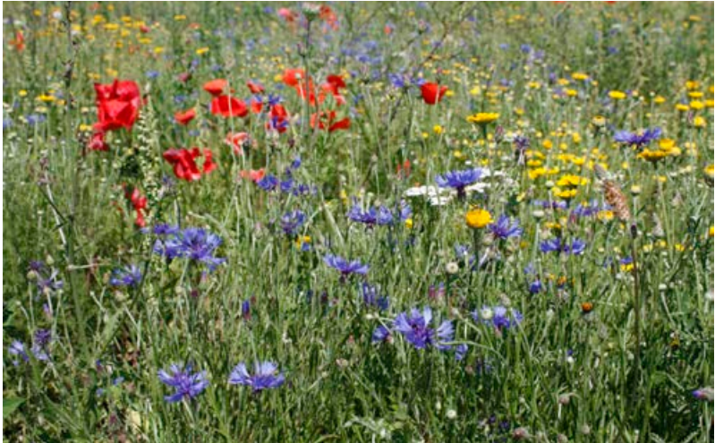
Blühaspekt einjähriger Ackerwildkräuter in einer Wildpflanzenmischung [13]

dann im zweiten Jahr von den ausdauernden Arten abgelöst werden. Für jede Region ist zu prüfen und mit Landnutzern abzustimmen, ob ausgewählte Arten ein Problem für angrenzende landwirtschaftliche Flächen darstellen können.