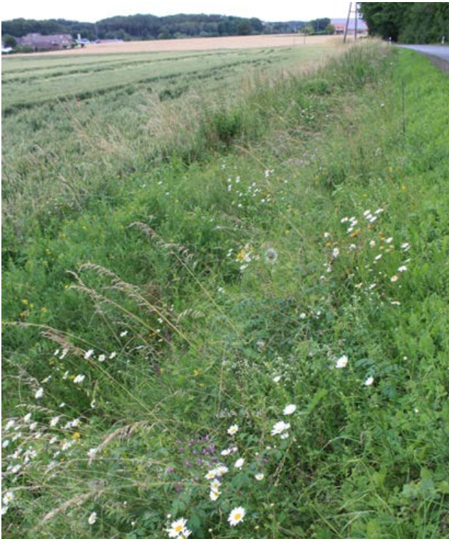
Artenreicher, mesophiler Feldrain [4]

Der Beitrag von Saumstrukturen zur pflanzlichen Biodiversität im Naturraum ist generell als hoch einzuschätzen (Dierschke 2000), aber er variiert je nach Landschaftsraum und Landnutzungsintensität (Link 2003, Dengler et al. 2006 & 2007). Bei zunehmender Nutzungsintensivierung dienen Säume und Feldraine zunächst als Rückzugsräume (z. B. Link 2003, Oppermann 1998, Ruthsatz et al. 1987), von denen aus nach lokalen Aussterbeprozessen eine Wiederbesiedlung benachbarter Flächen erfolgen kann. Wenn auch diese Strukturen durch Umbruch, zu intensiver Nutzung oder Vernachlässigung zurückgehen, dann verschwinden immer mehr Pflanzenarten und die von diesen Lebensräumen abhängigen Tierarten aus der Landschaft.