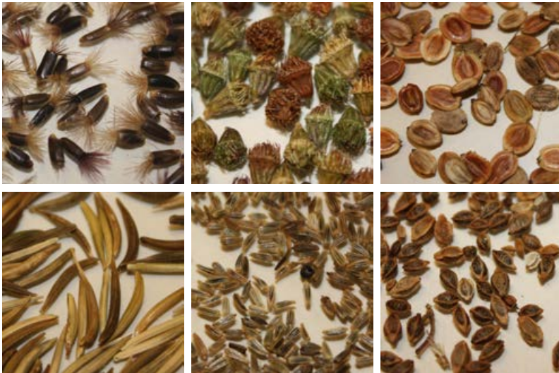
Samen und Früchte verschiedener Pflanzenarten: Von links oben nach rechts unten: Skabiosen-Flockenblume, Kleiner Odermennig, Gewöhnlicher Pastinak, Wiesen-Bocksbart, Wiesen-Margerite, Kleiner Wiesenknopf* [11]

Besonders wichtig für die Artenauswahl sind die Bodeneigenschaften (z. B. sandig oder lehmig, sauer oder basenreich), die Feuchtebedingungen (z. B. trocken, frisch oder feucht) und die Beschattung. Als Saumstandorte eignen sich vor allem unbeschattete bis mäßig beschattete Bereiche. Für nährstoffreiche Böden müssen Arten ausgewählt werden, die einerseits konkurrenzkräftig genug sind, um sich gegenüber unerwünschten Gräsern und Ruderalarten durchsetzen zu können und andererseits nicht dazu neigen, Dominanzbestände zu bilden. Auf nährstoffärmeren Böden können auch konkurrenzschwächere Arten beigegeben werden.