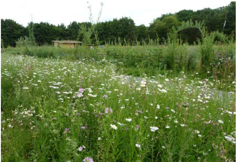
Blütenreicher Saum im 2. Jahr, der durch eine Urban-Gardening-Initiative in Osnabrück angelegt wurde [28]