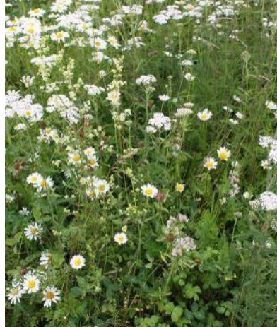
Blockversuch Wallenhorst nach 33 Monaten, Ansaat mit 37 Arten, Vorbehandlung 1x Fräsen, Folgepflege September