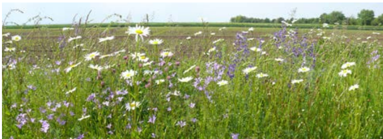
Feldrain im 4. Jahr nach der Ansaat; Aspekt mit Wiesen-Glockenblume, Wiesen-Salbei und Wiesen-Margerite [33]