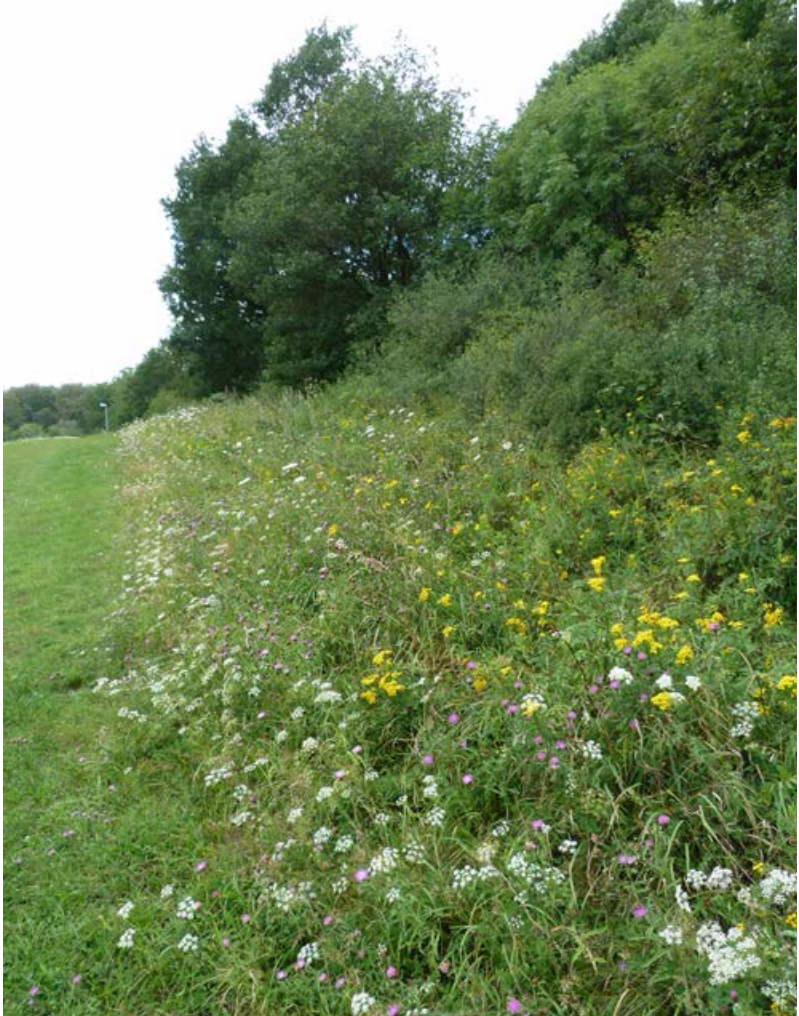
Noch ursprünglicher, artenreicher Saum an einem Waldrand [6]

In besonders artenreichen Beständen können Samen oder samenreiches Mahdgut direkt geerntet werden. Mit diesem Material ist eine Aufwertung bestehender verarmter Säume oder eine Neuanlage von artenreichen Säumen und Feldrainen kostengünstig möglich (Anderlik-Wesinger 2002).