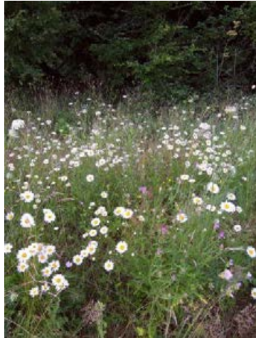
Landschaftssaum Osnabrück (Im Hone) nach 22 Monaten, Ansaat mit 27 Arten