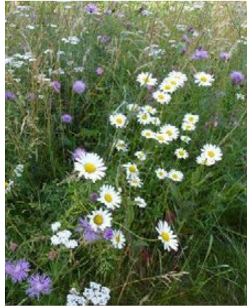
Landschaftssaum Wallenhorst (In der Barlage) nach 22 Monaten, Ansaat mit 27 Arten