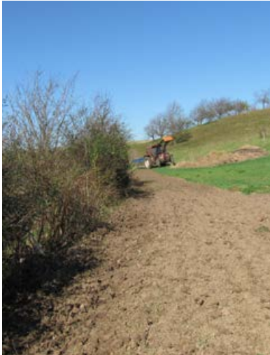
Neuanlage an Hecke [7]