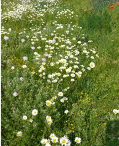
Blockversuch Bernburg nach 20 Monaten, Ansaat mit 49 Arten, Vorbehandlung 1x Fräsen, Folgepflege Juni-Mahd