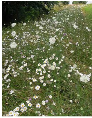
Landschaftssaum Wallenhorst (B68-3) nach 22 Monaten, Ansaat mit 27 Arten