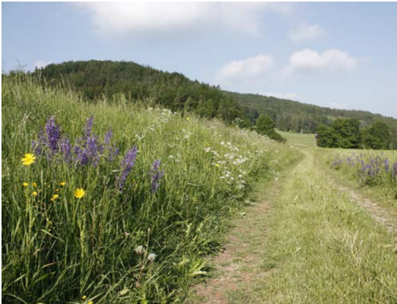
Noch ursprünglicher, artenreicher Wegrain [1]

Wer mit offenen Augen durch die Natur geht, erlebt, dass nicht nur farbenprächtige Blumenwiesen sondern auch Randstrukturen wie artenreiche Säume und Feldraine mehr und mehr aus der Landschaft verschwinden (Schäpers 2012, Link 2003, Weber 2003). Vor allem in intensiv genutzten Agrarregionen existieren heute vielfach nur noch artenarme Saumfragmente, die von konkurrenzstarken Gräsern und nährstoffliebenden, mehrjährigen Ruderalarten dominiert werden. Eine wesentliche Ursache des Artenrückgangs ist die fehlende oder ungeeignete Pflege der Säume und Feldraine. Sie werden meist nur gemulcht; häufig auch in zu kurzen Abständen. In ausgeräumten Landschaften ist eine spontane Wiederbesiedlung von Saumstrukturen auch nach einer Bodenstörung nahezu ausgeschlossen, weil sowohl im Landschaftsraum als auch in der Samenbank des Bodens für artenreiche Säume typische Arten kaum noch vorhanden sind.