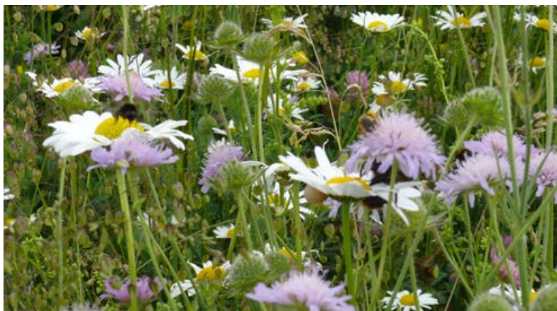
Renaturierter Feldrain im 4. Jahr; Aspekt mit Wiesen-Margerite und Wiesen-Witwenblume [14]