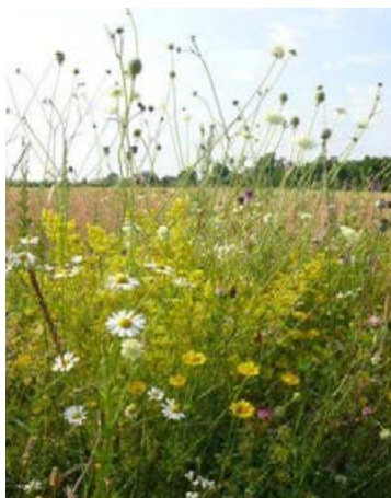
Landschaftssaum Bernburg nach 28 Monaten, Ansaat mit 49 Arten, Vorbehandlung 2x Fräsen