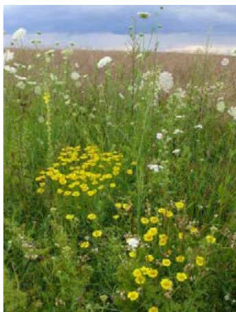
Landschaftssaum Bernburg nach 16 Monaten, Ansaat mit 49 Arten, Vorbehandlung 2x Fräsen