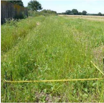
Landschaftssaum Lindau 2 nach 10 Monaten, Ansaat mit 46 Arten und Ammensaat