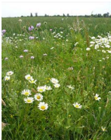
Blockversuch Bernburg nach 20 Monaten, Ansaat mit 49 Arten, Vorbehandlung 1x Fräsen, Folgepflege September-Mahd