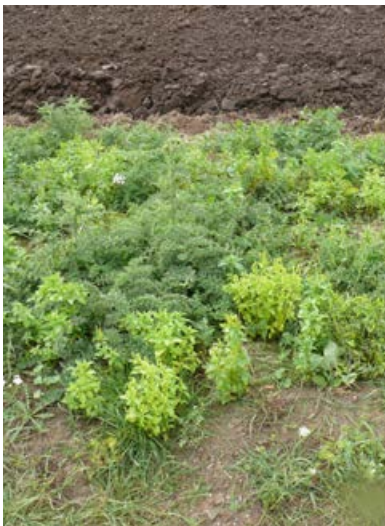
Massenaufreten von Weg-Distel [21]

Besteht die Gefahr, dass problematische Arten (z. B. Kletten, Weg-Distel, Acker-Kratzdistel, Stumpflättriger Ampfer, Krauser Ampfer) oder invasive Neophyten sich zu Dominanzbeständen entwickeln, sollten zusätzliche Managementmaßnahmen, wie z. B. das regelmäßige Ausmähen betroffener Bereiche oder ein selektives Ausstechen einzelner Pflanzen eingeleitet werden. Wichtig ist, dass rechtzeitig, d.h. deutlich vor der Samenreife der Problemarten, eingegriffen wird. Eine Mahd im Knosp stadium hat sich beim Zurückdrängen von Distelarten besonders bewährt.