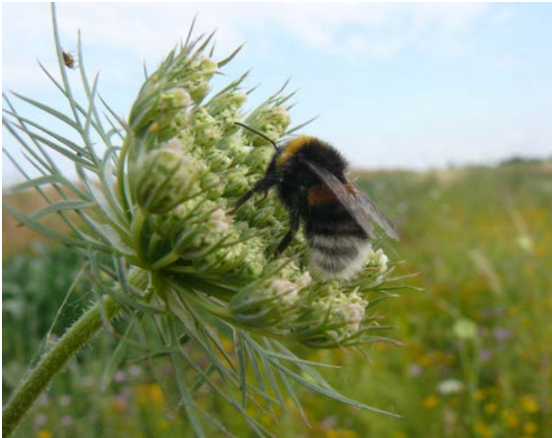
Wilde Möhre mit Hummel [34]

www.regionalisierte-pflanzenproduktion.de/