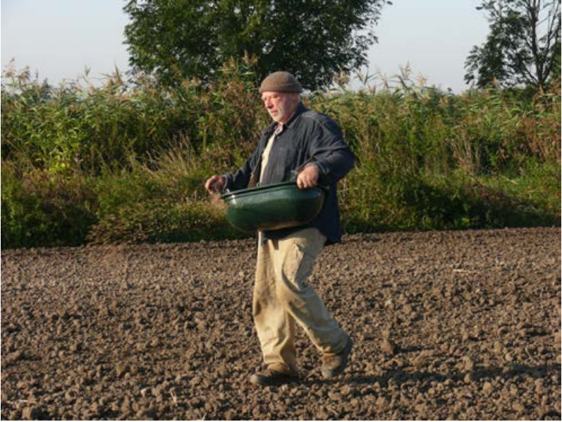
Handsaat mit Saatwanne [18]