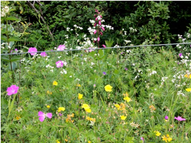
Artenreicher Saum am Rande einer Weide [3]

Ursprüngliche meso- und thermophile Säume und Feldraine sind typische Elemente alter Kulturlandschaften, die häufig besonders artenreich sind, da sie neben saumtypischen Arten auch Arten angrenzender Biotope (z. B. Grünland, Magerrasen oder Wald) enthalten (Dierschke 2000, Dengler et al. 2006, Kiehl & Kirmer 2019). Kräuterreiche, mehrjährige Säume und Feldraine sind zudem wichtige lineare Verbindungsstrukturen zwischen verschiedenen Lebensräumen und Nutzungstypen in der Kulturlandschaft. Sie dienen dem Biotopverbund und sind Nahrungs-, Fortpflanzungs- und Überwinterungshabitate für Bestäuber und andere Nützlinge (Oppermann 1998, Schäpers 2012). Sie bieten Vögeln, Feldhasen, Kleinsäugetern und Insekten einen Rückzugsraum und erfüllen weitere wichtige Ökosystemdienstleistungen, wie z. B. Erosionsschutz. Darüber hinaus bereichern sie durch ihren Blühaspekt das Landschaftsbild und erhöhen so die Lebensqualität.