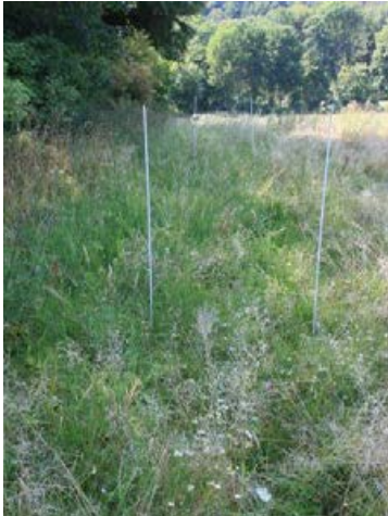
Landschaftssaum Osnabrück (Im Hone) nach 10 Monaten, Ansaat mit 27 Arten