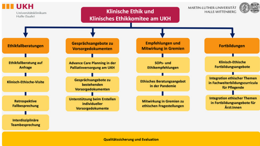
Abb. 1 Klinisch-ethisches Leistungsspektrum am Universitätsklinikum Halle (Saale)

Angesichts der Möglichkeit, durch ACP-Gespräche die Entscheidungsfindung in der klinischen Praxis und im Kontext von Ethikfallberatungen zu unterstützen, wurde ein ACP-Angebot im Sinne einer „präventiven Ethik“ (Schuchter et al. 2018; Wachter und Karschuck 2022) in das klinisch-ethische Leistungsspektrum am UKH aufgenommen (siehe Abb. 1). Gegenstand dieser Arbeit ist zum einen die Darstel-