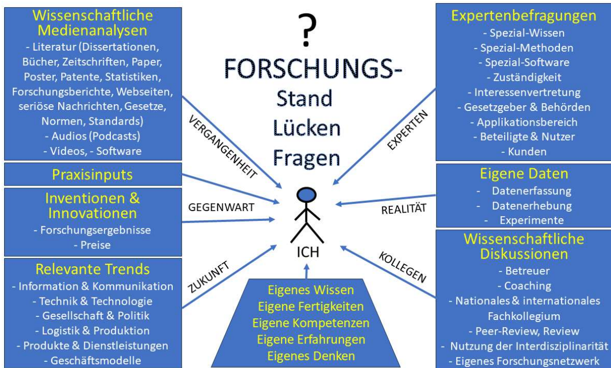
Abbildung 3: Ganzheitliche Recherche zum Aufdecken des Stands des Wissens, der Identifikation einer/mehrerer Forschungslücke/n und der Formulierung von Forschungsfragen

Publikationen, Expertengesprächen, aktuellen Tagesnachrichten aufnehmen und listen.