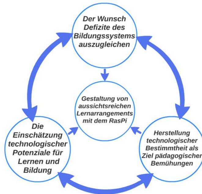
Abbildung 3: Kernkategorien der Theorie mit angedeuteten Wechselwirkungen