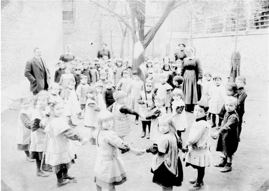
Abb. 3: Kindergarten in der Deutschen Schule um 1903.

erste Stunde am Vor- und Nachmittag war eine Spielstunde im Freien. Um neun Uhr morgens versammelten sich die Kinder im Zimmer, wo sie erst zwei Verse eines Morgenliedes sangen. 30 Anschließend wurde gebetet. Meist sprach die Diakonisse das Gebet vor, die Kinder laut nach. Nach der Erzählung einer biblischen Geschichte (illustriert durch möglichst viele Bilder) mussten die Kinder einen kurzen Bibelspruch aus der erzählten Geschichte auswendig lernen. Im Anschluss daran folgten unterschiedliche Übungen wie beispielsweise „exercirmäßiges Bewegen des Körpers auf ein gegebenes Commandowort“ (Fliedner 1862: 258). Dies würde sowohl „ihren Geist mit neuer Munterkeit“ erfüllen als auch die Glieder stärken und gelenk machen. Außerdem würden sie durch diese Übung „Ordnung und pünktlichen Gehorsam“ gelehrt (ebenda). Am Nachmittag wiederholten die Kinder leichte Liedverse und biblische Sprüche und spielten im Freien. Der Rest des Nachmittags beinhaltete „Unterhaltung über Gott und seine