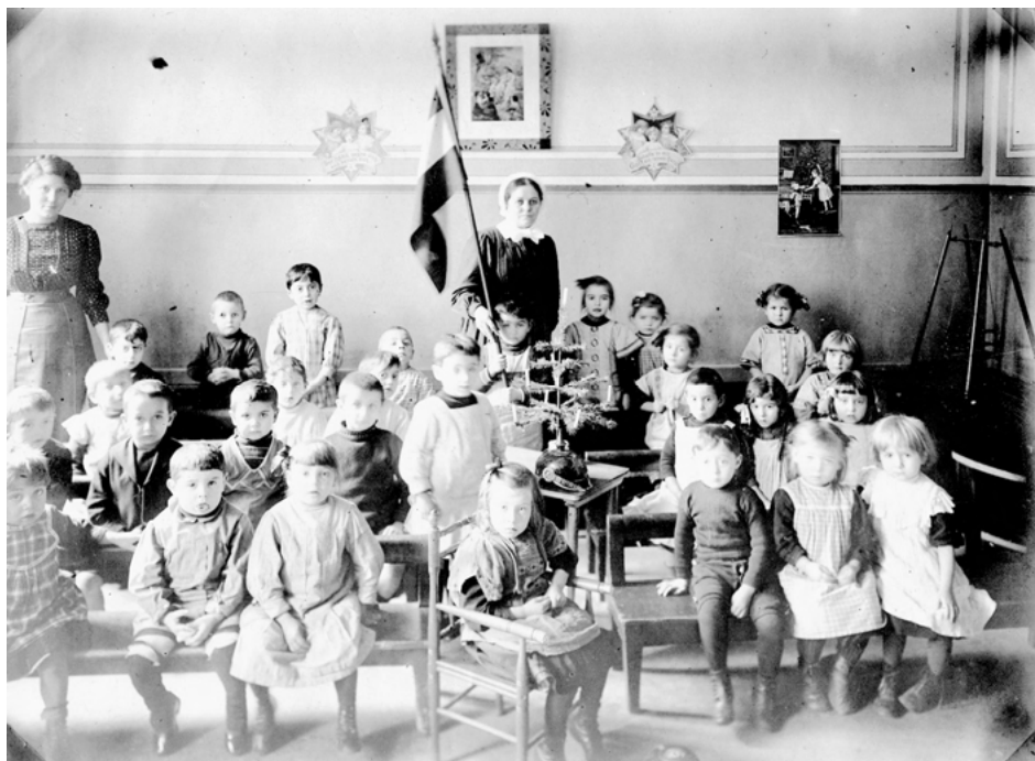
Abb. 2: Kindergarten in der Deutschen Schule um 1897.

Diese Symbiose von geistlicher und weltlicher Macht kommt auch auf den Fotos des Deutschen Kindergartens deutlich zur Geltung. Abbildung 1 zeigt die versammelte Kinderschar mit ihrer Lehrdiakonisse in der Mitte. Vier Kinder halten deutsche Reichsfahnen, links und rechts sitzen Kinder in hölzernen Spielschiffen. Das Spielschiff links im Bild trägt, wie das deutsche Stationsschiff, den Namen „Loreley“.