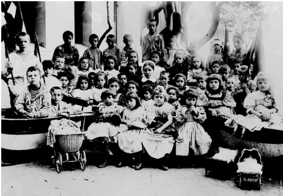
Abb. 1: Teutonia-Kindergarten um 1882 (undatiertes Foto im Besitz des Deutschen Kindergartens in Istanbul).

cher Bibelgeschichten bediente. Kleinen Kindern sollten zum Beispiel Geschichten erzählt werden, die der kindlichen Phantasiewelt entsprachen. Neben dem Vorlesen aus der Bibel war das gemeinsame Singen der zweite elementare Bestandteil des Fließenden Unterrichts. 1842 veröffentlichte der Diakoniegürnder das erste „Liederbuch für Kleinkinderschulen“, das mit seinem umfangreichen Anhang gleichzeitig ein Lehrbuch für Kleinkinderlehrerinnen war. Noch 1901 wurde das Liederbuch in seiner 13. Auflage gedruckt (Felgentreff 1998: 42). Sein Inhalt ist keineswegs nur christlich. Wie alle anderen Kaiserswerther Publikationen war auch das Liederbuch politisch. Neben Liedern „für christliche Festzeiten“ wie Ostern, Weihnachten etc. sangen die Diakonissen mit den Kindern auch „Vaterlands-Lieder“, beispielsweise zum Geburtstag des Königs 28 , der regelmäßig im Kindergarten gefeiert wurde. 29