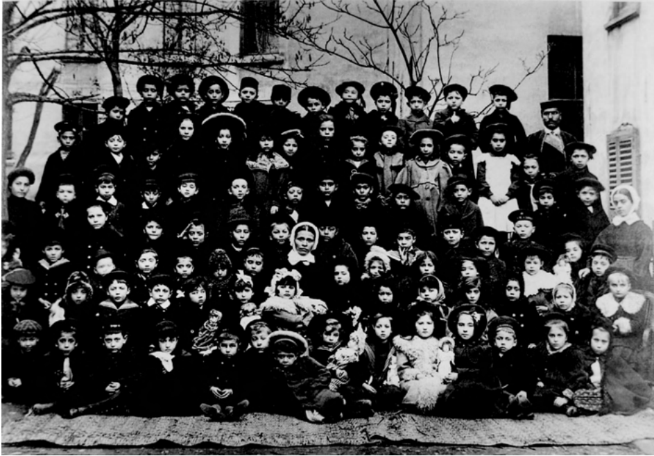
Abb. 6: Kindergarten in der Deutschen Schule 1904 (undatiertes Foto im Besitz der Deutschen Schule Istanbul).